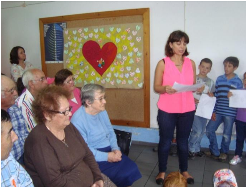
Os idosos da Casa de Repouso João Inácio de Sousa presentearam-nos com um belo painel de corações, elaborado pelos 80 utentes da instituição, e com a leitura de um poema para os mais novos refletirem.