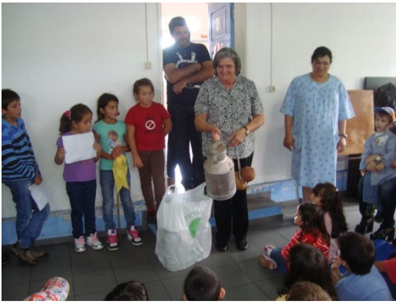
Partilha de vivências por parte dos idosos.